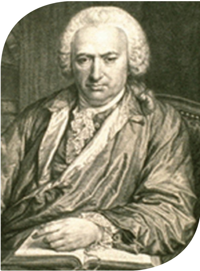
Charles Bonnet Naturforsker og filosof (1720 - 1793)